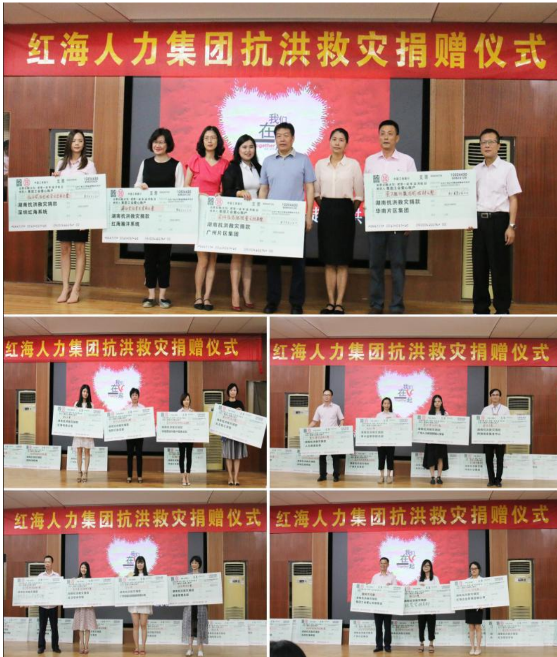
各单位纷纷响应集团号召, 积极捐款