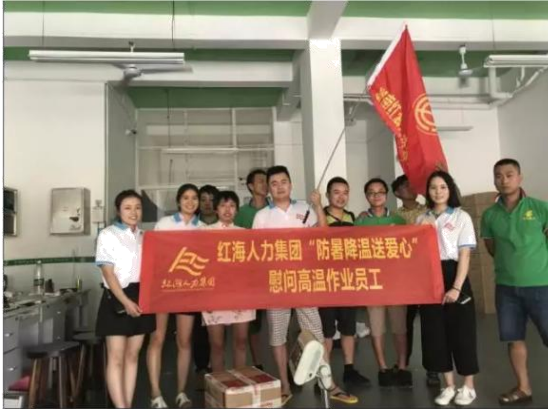
韶山南路揽投部工作人员合影

每到一处，他们不仅给投递员们送上慰问品，还深入工作现场，开展安全生产、防暑降温和中暑应急知识宣传教育，并叮嘱员工们要合理调整作息时间，确保身体健康和出行安全。现场员工们接到娘家湖南红海送来的慰问品纷纷表示，在强烈的阳光照射下，虽然感到闷热难受，但感受到了娘家送来的关怀和关爱，并保证一定会克服酷暑高温，坚守岗位，尽职尽责的做好投递服务工作。