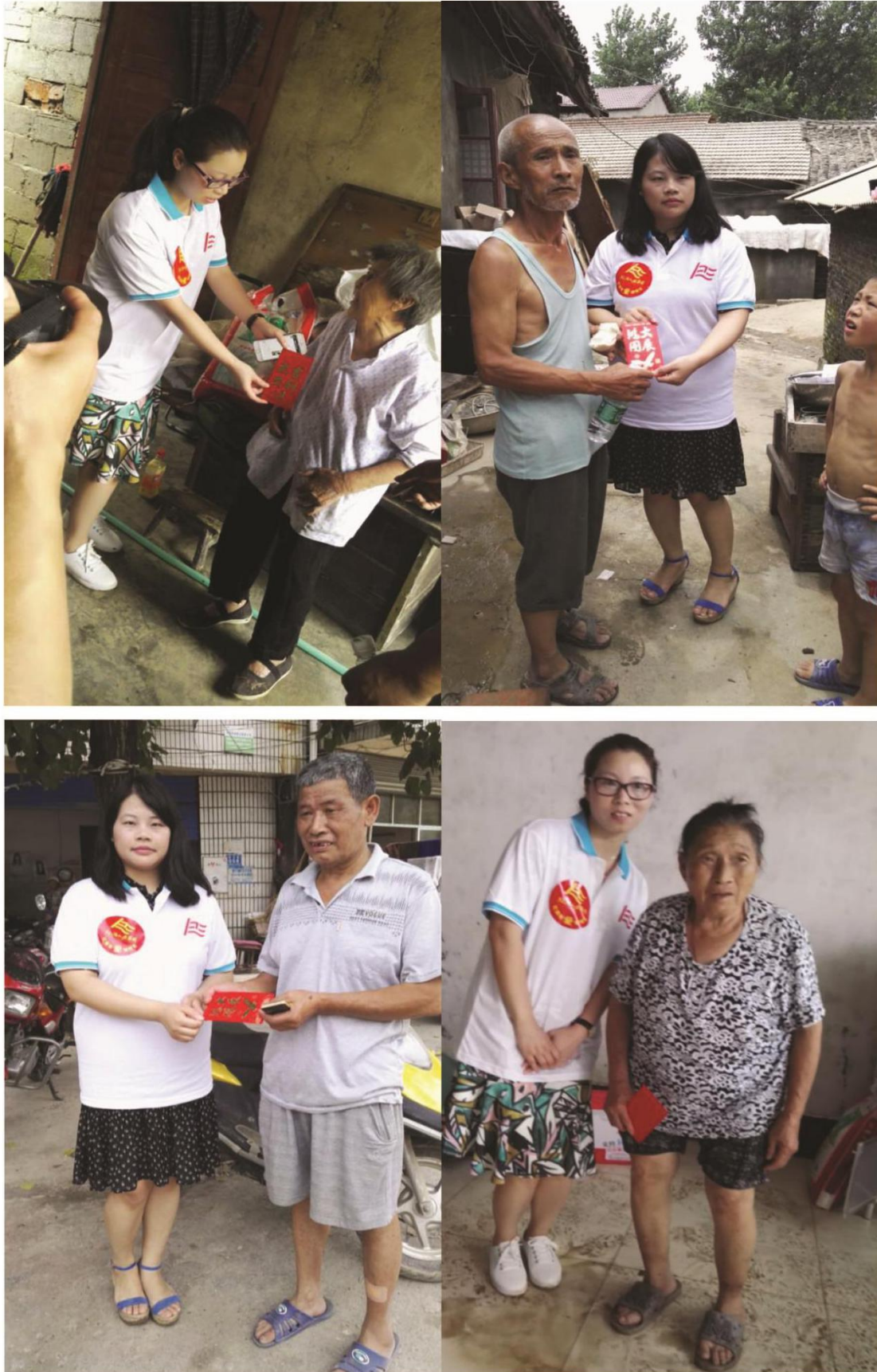
(每一筆善款和物資都精準的發放到需要幫扶的受災民眾手中)