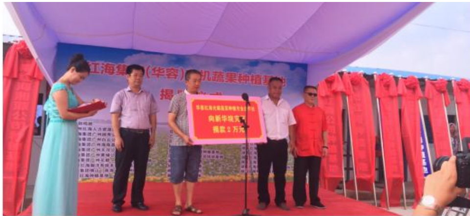
(图 1 华容有机蔬果种植基地揭牌现场)

1、为加强农企合作，为了使红海员工、客户与朋友走出困扰，吃上放心蔬菜，品尝健康水果，促进农企合作，与华容县鱼口村多家农户共同成立了华容县红海光耀蔬果种植专业合作社，已完成投资 1200 万元，发展有机蔬果种植面积近千亩，建有高标准有机蔬果种植标准大棚 200 个。