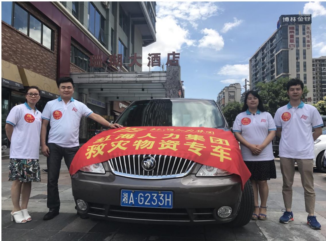
(图为：准备出发至怀化辰溪赈灾的湖南红海红海代表)