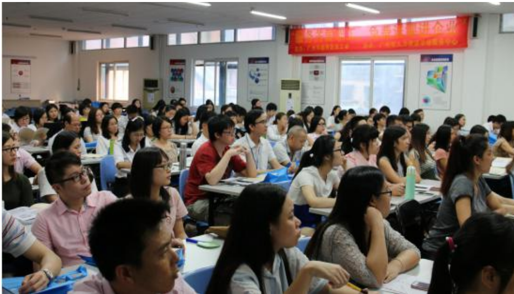
（图 5 职业素养培训现场）

3、为了提高员工的安全素养，进一步强化各项预防措施，落实安全生产主体责任，有效防范和坚决遏制重特大事故，进一步提升安全生产总体水平，公司每年 6 月份开展安全教育和安全检查活动。