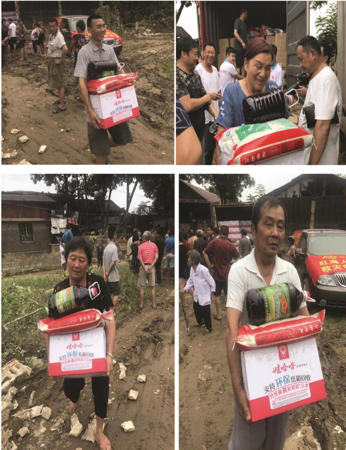
（红海与怀化民政局代表把物资发放到受灾民众手中现场）

抵达目的地后，红海与怀化民政局代表，积极组织当地受灾民众，井然有序的前来领取物资。看着满满的爱撒向灾区民众，看着他们幸福的笑脸，此时此刻身作为一名红海人倍感骄傲和自豪！红海你真是棒棒哒！红海派出的几位代表前往辰溪赈灾，是在集团总部的统筹安排