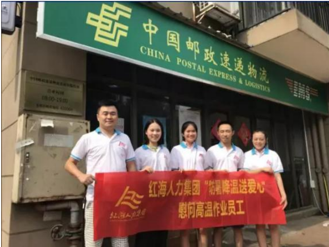
湖南红海前往中国邮政速递物流省政府揽投部合影

炎炎夏日，高温酷暑。为确保一线职工揽投员安全度夏，连日来湖南红海在长沙邮政、速递物流天心区韶山南路揽投站，省政府揽投站开展了“夏日送清凉”慰问活动，为坚守在高温下工作一线的快递员工送去了“清凉”和“娘家人”（红海）的关怀。