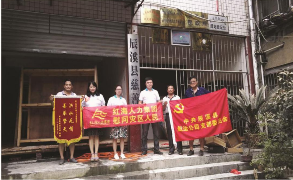
（图为：红海人力集团获得一面锦旗）

汇聚成一股股爱的暖流，流淌至辰溪民众心中；“精准帮扶“要把每一笔善款和物资都精准的发放到每一位受灾民众手中。