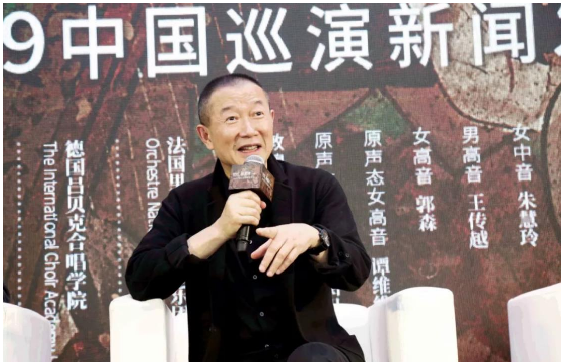
图：2019年谭盾《敦煌·慈悲颂》全国巡演发布会现场