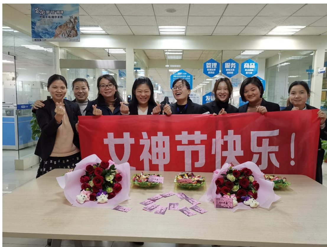
2019年3月8日“女神节”，这一天由男神为女神服务，并为每位女神准备了专属礼物