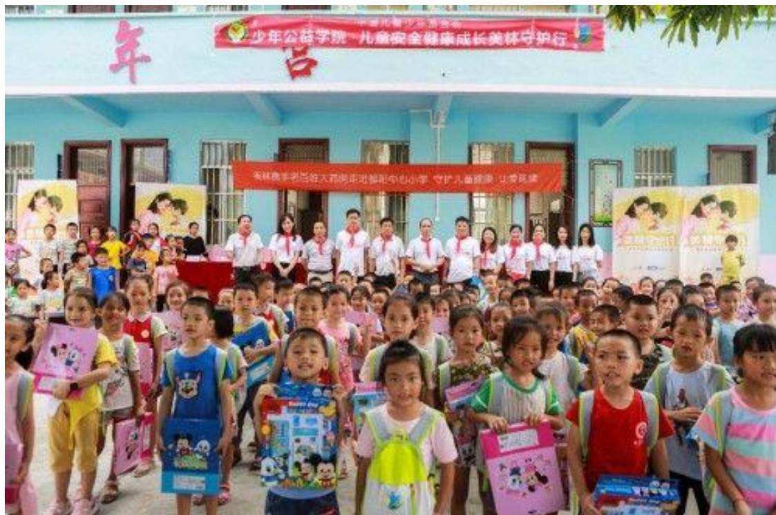
2019 年 9 月，老百姓大药房“儿童安全健康成长守护行动”帮助孩子更好地学习与成长