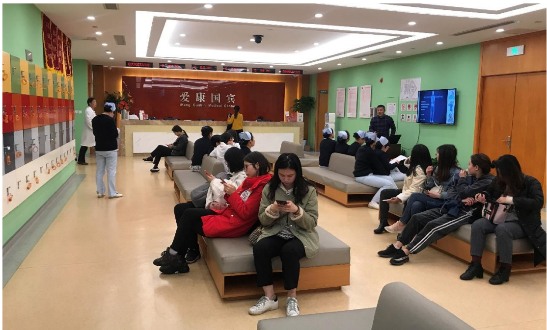
2019 年 3 月，女员工参加每年一次的女性健康体检

老百姓大药房始终将员工的职业安全当作首要工作，不断改善员工的工作环境，减轻员工的劳动强度，加大职业病的防治力度。公司为员工提供锻炼、健身场所，并组织多种运动和比赛活动。集团还与相关医疗机构合作，提供常年健康体检，并为特殊年龄段及女性员工增加相关体检项目。