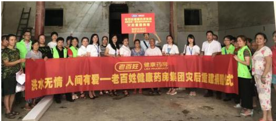
2019 年 7 月，老百姓大药房捐赠现金、物资共计 8 万余元，支援湖南洪灾灾后重建