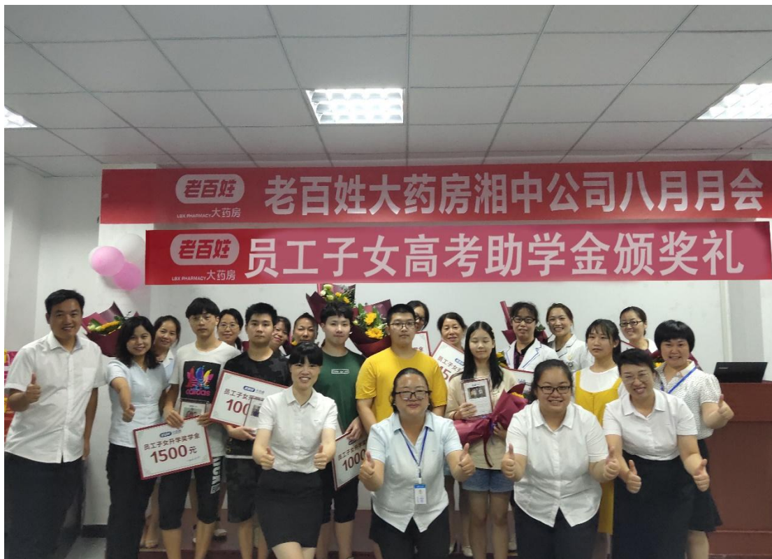
2019年8月，组织员工子女高考升学活动，为其发放助学金