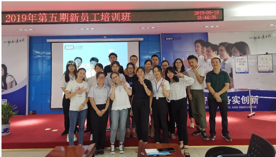
2019年9月，老百姓大药房新员工第五期培训班掠影