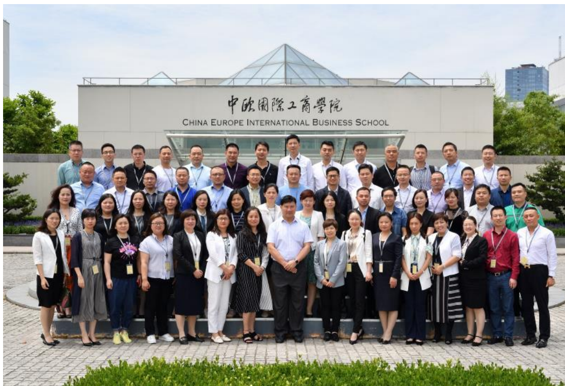
2019 年 8 月，老百姓大药房高级管理人员在中欧国际工商学院企商班开班合影