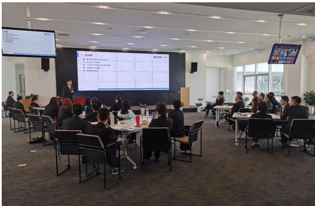
老百姓大药房督察审计中心开展反腐倡廉专题学习和培训