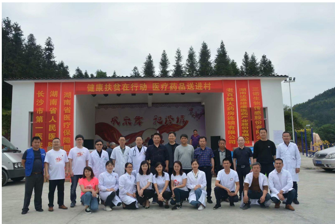
2019 年 5 月，老百姓大药房向湖南省安化县小淹镇胜利村村民捐赠价值 12 万元药品