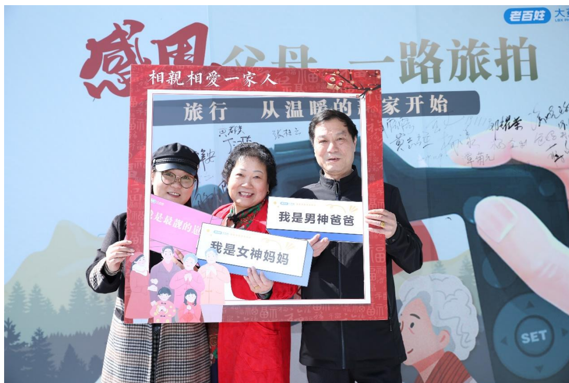
2019 年 10 月，组织“感恩父母·一路旅拍”活动，给员工一次与父母一起旅拍的机会

2018 年，老百姓大药房在原“五心基金”基础升级改版，建立“员工关怀管理”四计划，通过感恩父母计划、培育子女计划、职业学习计划、暖心慰问计划来培养员工的孝心、爱心、上进心、善心、责任心，弘扬中华民族传统美德。