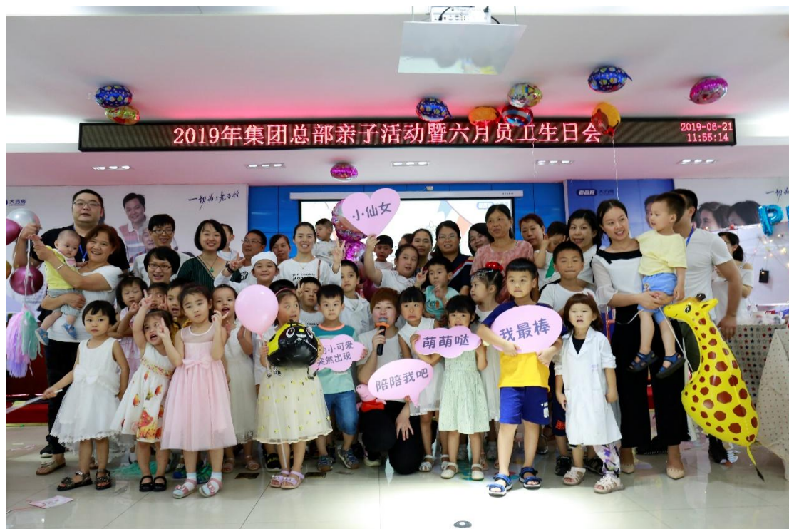
亲子活动暨六月员工生日会，把小朋友带进公司，共享欢乐亲子时光