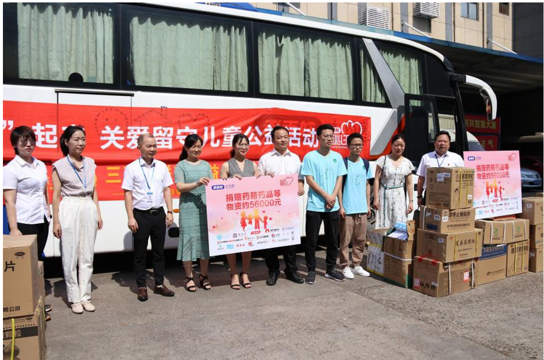
2019年6月，老百姓大药房开展“健康‘益’起来·关爱留守儿童公益活动”

2019年9月，老百姓大药房在湖南中医药大学设立优秀学子奖励基金项目，资助贫困学子，项目时长3年，每年20万元。