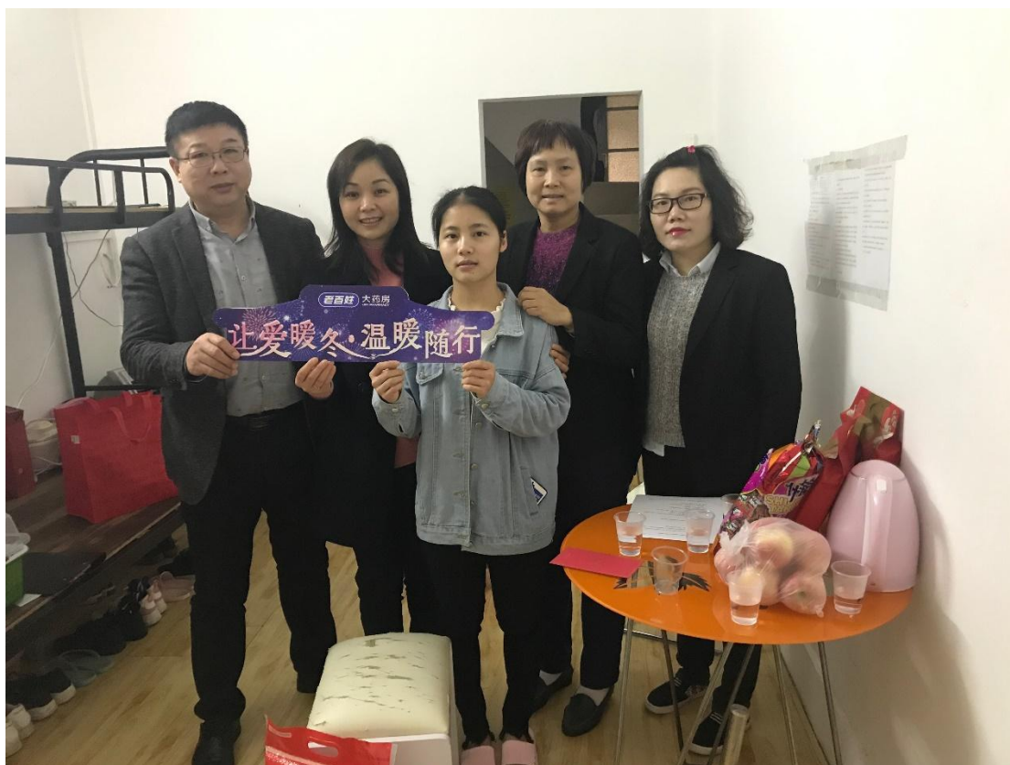
2019年春节前后，组织困难职工慰问活动，为困难员工送上礼金与祝福