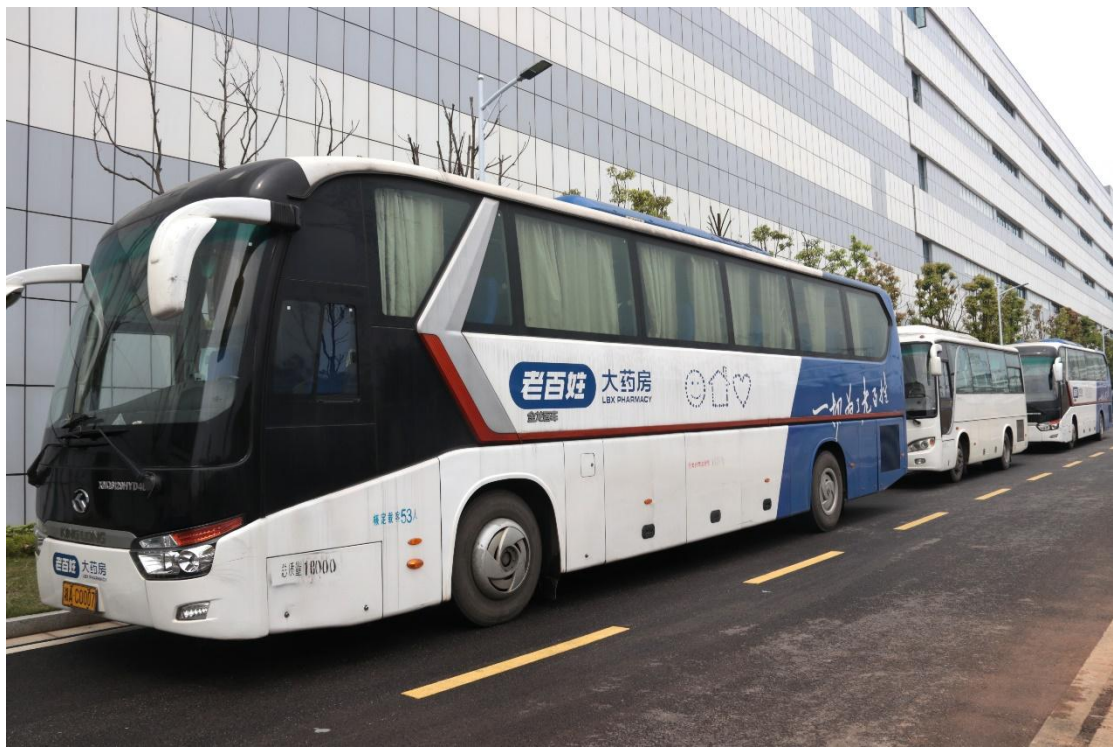
开通员工班车，提供住房补贴及交通补贴，保证员工都能安居乐业

了责、权、能、利高度统一的薪酬体系；员工福利方面，除严格执行国家以及地方法律法规，为员工提供五险一金、带薪休假等基本法定福利外，还为对应员工提供了意外伤害险、重大疾病保险、商业养老保险、税优险等补充保险项目，尽力帮助员工解决后顾之忧；集团总部及下属企业开办了员工食堂，开设了员工班车，并提供住房补贴及交通补贴，保证员工都能安居乐业。