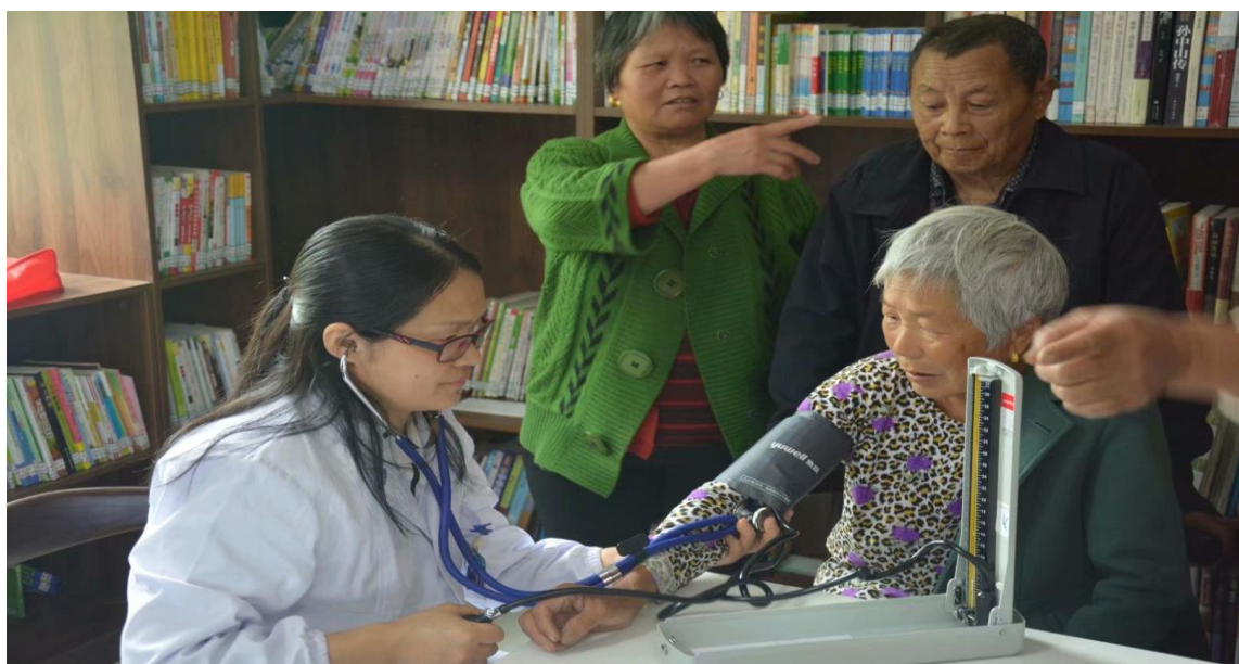
2019 年 5 月，老百姓大药房在湖南省安化县小淹镇胜利村开展义诊及送医送药活动

2019 年 7 月，老百姓大药房积极参与湖南洪灾爱心捐赠灾后重建扶贫活动，捐赠现金、物资共计 8 万余元。