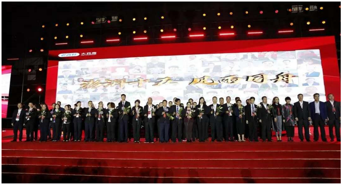
2019 年 10 月，公司为入职五年、十年、十五年、十八年的员工授予荣誉勋章