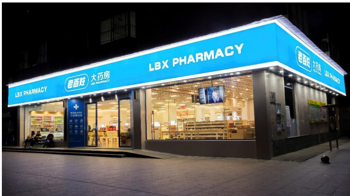
节能环保的新材料、新产品、新工艺在门店的应用