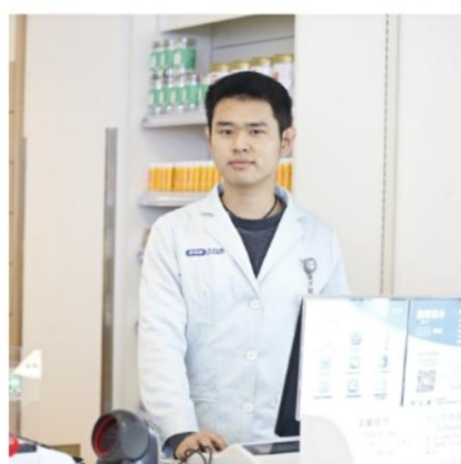
2019 年第一届优秀“小白杨”掠影