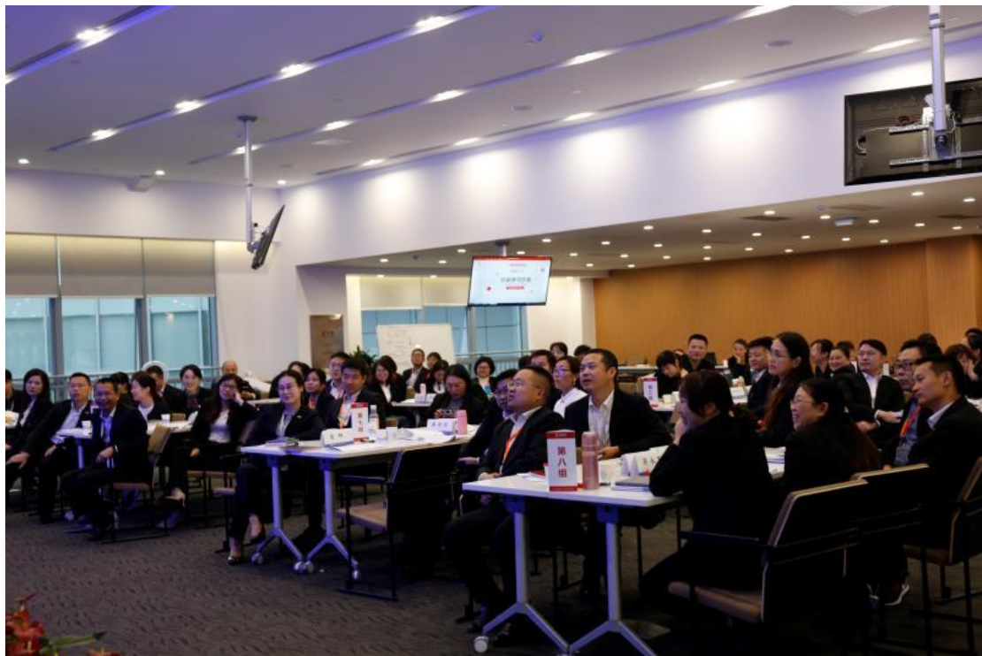
2019 年 9 月，老百姓大药房中层管理干部训练营培训掠影

深耕药学服务核心专业储人才培养。 2019 年成功考取执业（中）药师资格证书近 1000 人；以一线为原点建立带教营地，对储备营运管理人员进行师带徒专项试点，共培养合格储备店长 1358 人；稳定保持 1000 人左右的内部兼职讲师队伍，开展每半年 1 次全国优秀讲师集中训练营、每月线上课堂固定学习保持讲师业务水平；与中欧国际商学院等高校联合批量定制组织实施针对中高级管理人员综合能力提质的 LBX-MBA、EMBA 班。