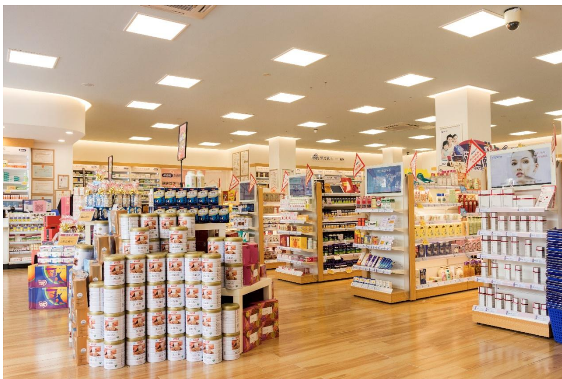
优化卖场吊旗、吊牌、竖幅、KT板等物料，采用可重复利用的陈列宣传道具