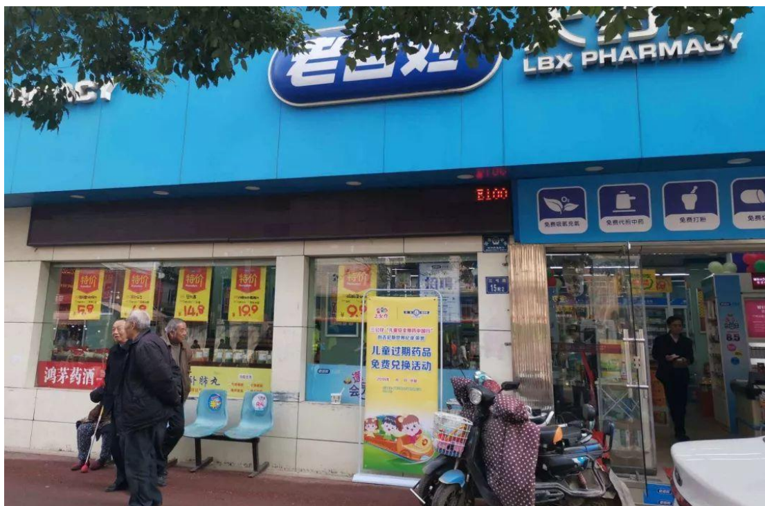
2019年3月，老百姓大药房湖北公司联合广药集团开展家庭过期药品回收活动

公司每年都会开展的“过期药品回收”活动，号召市民合理购药以免浪费，并对过期药品进行回收，在药监部门监督下封存销毁，从而防止过期药品重新流入社会危害群众健康或因随意丢弃而污染环境。