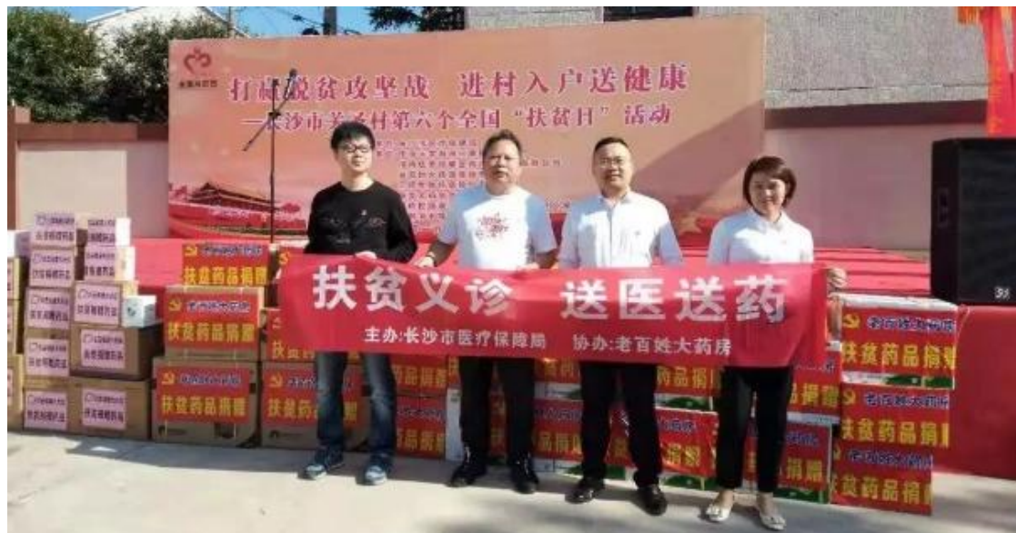
2019 年 10 月，老百姓大药房向湖南宁乡横石镇关圣村村民捐赠价值 10 万元药品

此外，公司还通过实地走访、年节慰问、医疗救助等多种形式，对孤寡老人、贫困居民实施救助活动。