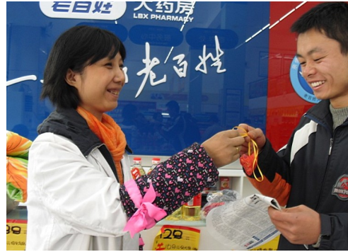
图14 门店药师为公交司机送上防流感香囊

2009年10月27日, 老百姓大药房在湖南长沙发起成立了“老百姓爱心汇”公益组织, 成为我国第一个自发进行造血干细胞知识宣传的药品零售企业。当天活动现场, 由“老百姓爱心汇”发起的“义卖大比拼”和“造血干细胞志愿捐献”活动同期进行, 老百姓大药房董事长谢子龙和公司其他50多名志愿者与现场群众一道加入了造血干细胞捐献者行列, 很多员工更是在采集血样后现场献血。“老百姓爱心汇”成立后, 每年将组织全国600多家门店开展6000多场爱心活动, 并积极宣传造血干细胞捐赠活动。