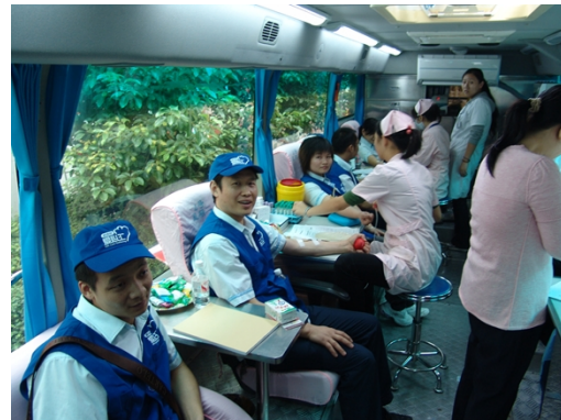
图15 “老百姓”员工积极报名捐献造血干细胞

2010年10月, 老百姓大药房启动义卖大比拼活动, 并向全国爱心捐赠30所中老年健康活动室, 总价值30余万元。