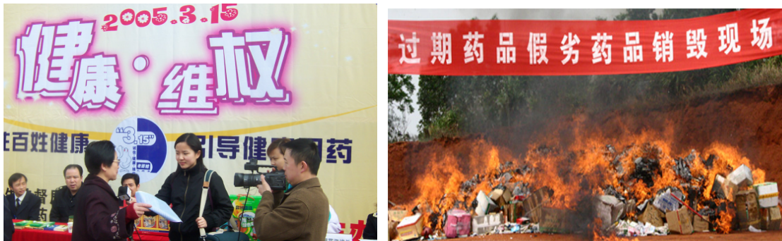
图2 过期药品回收及销毁大行动

另外,公司也经常通过晚会、活动、图片展等形式向消费者面对面地宣传节能环保知识和安全合理用药常识。例如,各省公司每年都开展的“过期药品回收”活动,为防止过期药品重新流入社会危害群众健康或因随意丢弃而污染环境,老百姓大药房每年都会投入大量资金,制作海报在门店和社区宣传栏进行张贴,号召市民合理购药以免浪费,并对过期药品进行回收,并根据药品价格水平兑换相应的礼品或现金券。公司每年都会回收上百吨的过期药品并联合各地政府监管部门一起进行销毁,每年投入到过期药兑换新药或现金券活动的费用就达200余万元。