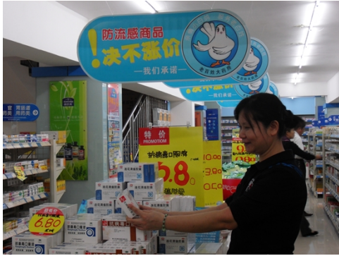
图13 流感期间, 抗流感药品绝不涨价

2009年11月, 老百姓大药房整合全国14个省市资源, 开展了向的士及公交车免费赠送200万个中药香囊的大型公益活动, 以此来预防流感在人口流动比较频繁的的士或公交车上进行传播。