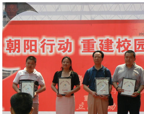
图5 爱心茶叶义卖，老百姓大药房认购1万元

2011年7月，为北京“天使之家”的孩子们送去一批常备药品。爱心让孩子们在酷暑感受到一丝清凉。