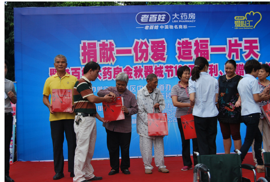
图17广西公司向福利敬老院捐赠爱心器械

2015年9月，老百姓大药房发起“不忘抗战老兵 致敬卫国英雄”为抗战老兵送健康学雷锋，一对一服务健康送上门志愿服务公益活动。宣扬爱国主义为核心的伟大民族精神，宣导全社会关注老兵健康，成立专业的亲情小白鸽专项志愿服务队，在长沙市内各区县市里的老百姓大药房门店组成药师志愿者分队实时跟踪访问所在区域的抗战老兵健康状况，为160多名老兵建立健康档案，进行健康维护。活动现场给老兵赠送健康联系卡，药师一对一为老兵服务并现场向抗战老兵赠送健康轮椅，提升老兵们的健康生活质量，专业用药咨询，健康管理，送药上门，节假日将为老兵们送福利送欢笑，致力为老兵们创造健康幸福生活。从实际出发关爱身边的老兵，学习他们不屈的民族气节，传承抗战精神。