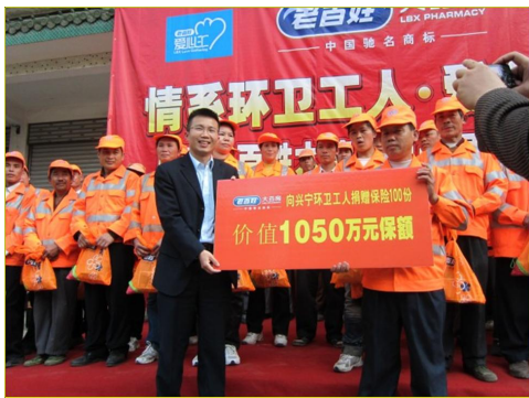
图16 广西公司为环卫工人捐赠人身意外伤害保险

2014年11月25日，老百姓大药房发起“尊重老人 为爱正名——老年痴呆症更名”活动，购买了价值近10万元的GPS定位手环赠与病患家庭。