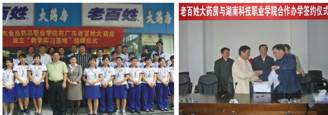
图10 老百姓大药房与多所学校合作成立教学实习基地，共同合作办学，吸纳学生实习就业

2011年1月11日，共青团湖南省委邀请了部分在湘的全国人大代表、全国政协委员、省人大代表、省政协委员以及新生代农民工代表共50余人，在老百姓大药房会议厅开展面对面沟通交流活动，探讨并了解新生代农民工的诉求，热议新生代农民工融入社会的问题。