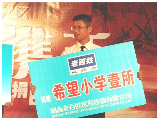
图4 老百姓大药房捐赠希望小学一所