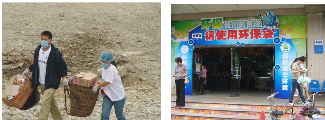
图3 宣传环保理念促进市民加强环保

保理念。除此以外，各省公司门店也充分利用卖场终端的优势，向顾客宣传环保理念，开展系列环保活动，来带动顾客参与环保。而且，省公司经常性地组织员工清扫街道，打扫社区公共卫生、开展社区公益演出等形式来加强城市文明建设。