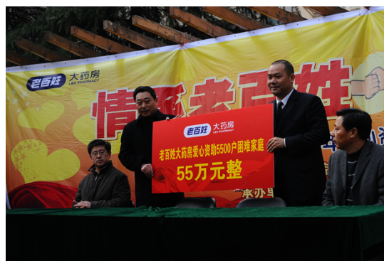
图12 爱心资助5500户困难家庭捐赠现场