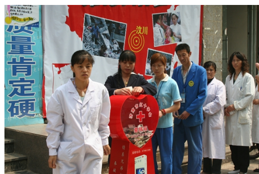
图9 抗震救灾“老百姓”积极参与救灾行动

2010年4月，青海玉树地震发生后，老百姓大药房伸出援手，第一时间向灾区捐赠价值100万元的外伤和常备用药。