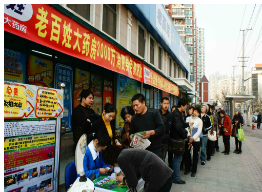
图11 市民排着长队领取免费购药券

2009年3月，即将成立的老百姓大药房江苏公司，在获悉受金融危机影响，很多低保户及下岗职工看病贵吃药难的情况后，立即与街道实行政企对接，开展了“55万元帮扶5500户困难家庭”的爱心行动，赢得了社会的广泛好评。