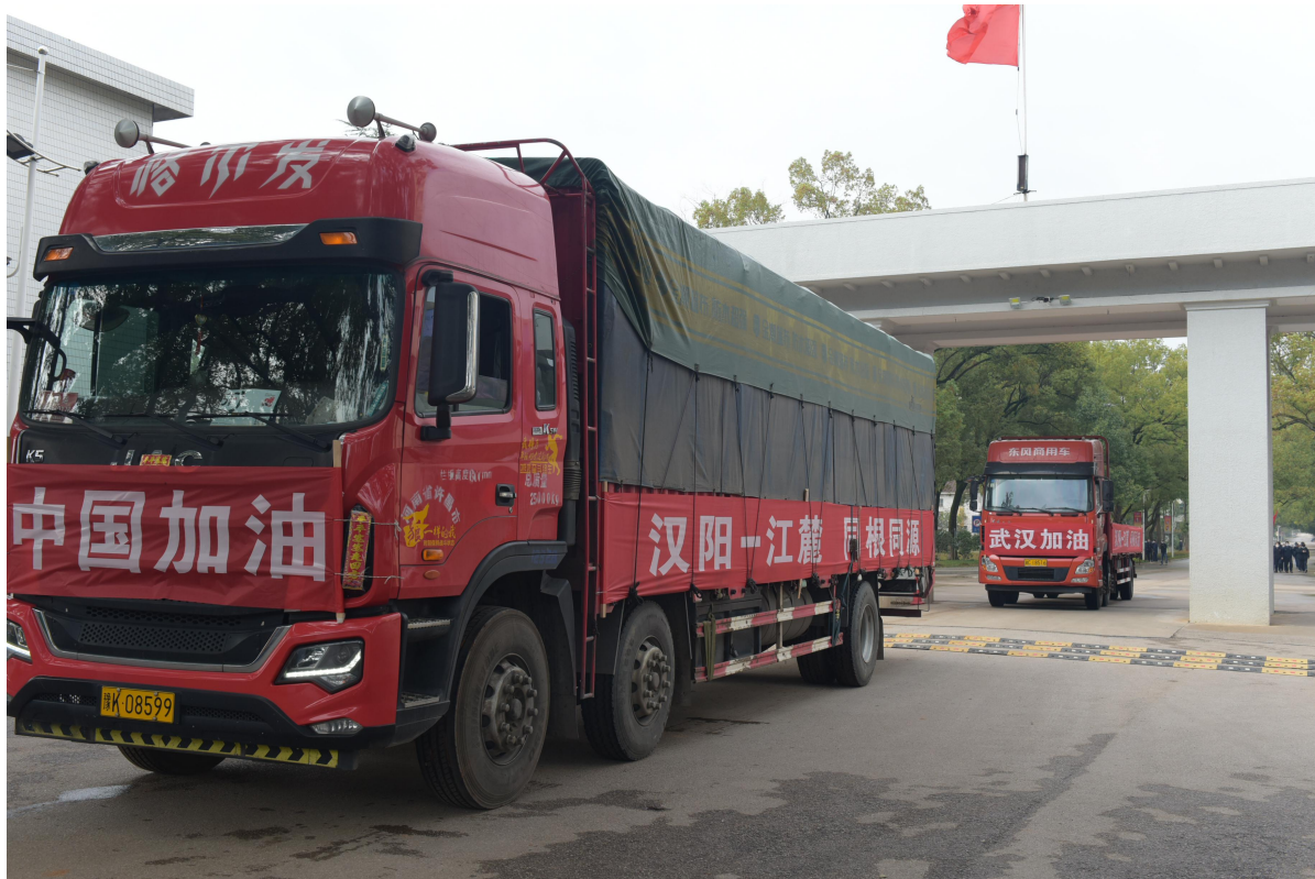
2020年3月1日下午，公司第一批口罩机、压条机发运出厂，支援抗疫阻击战

《江麓集团口罩机生产7天实现5个100%》《江麓“无中生有”》《转战口罩“跨界”战“疫”》《兵器工业江麓集团首批医用防护物资制造设备发》等稿件在中国日报网、《学习强国》中央企业学习平台、《国防科技工业》、新浪网、湖南卫视、《湖南日报》《中国兵工报》等各类媒体共计达110余次，彰显公司主动担当、勇挑重担的优质国企形象。