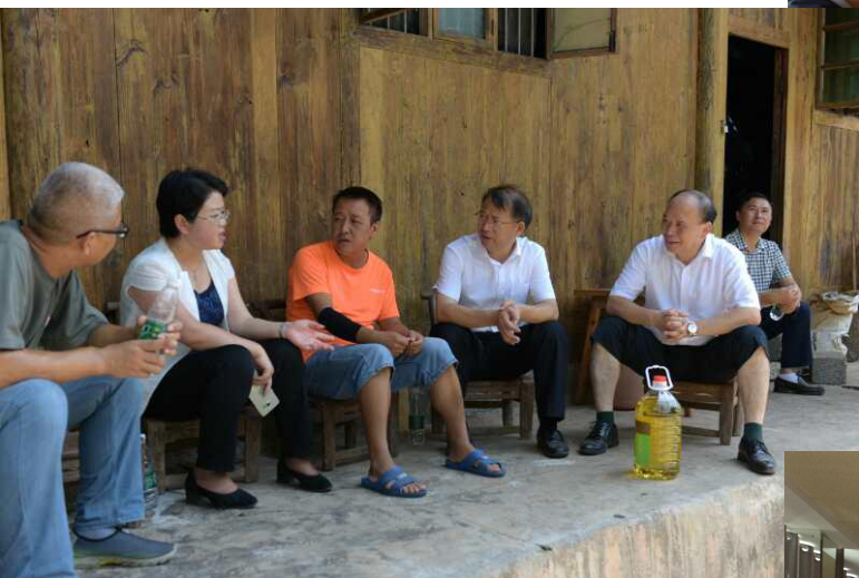
← 入户调查，慰问贫困家庭