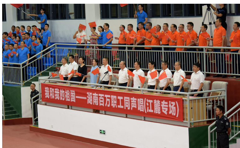
公司领导、雨湖区领导与公司职工同唱 “我和我的祖国”

队参加湘潭市职工工间操比赛，获得企业组第二名；组队参加湘潭市总工会“我和我的祖国”——职工大合唱比赛，获二等奖。成功举办了“庆国庆 迎中秋”文艺晚会、职工篮球比赛及体育馆落成开放仪式暨“我和我的祖国——湖南百万职工同声唱”活动，在体育馆开放仪式现场举行了职工啦啦操、工间操和柔力球表演，以及职工五人制足球、篮球对抗赛和职工气排球表演赛。开展管理干部健身运动，组织了健步走、跳绳、立定跳远、射箭、引体向上、射箭等个人赛和跳长绳集体赛，得到了广大管理干部的积极响应，参加人数达 1000 余人/次。