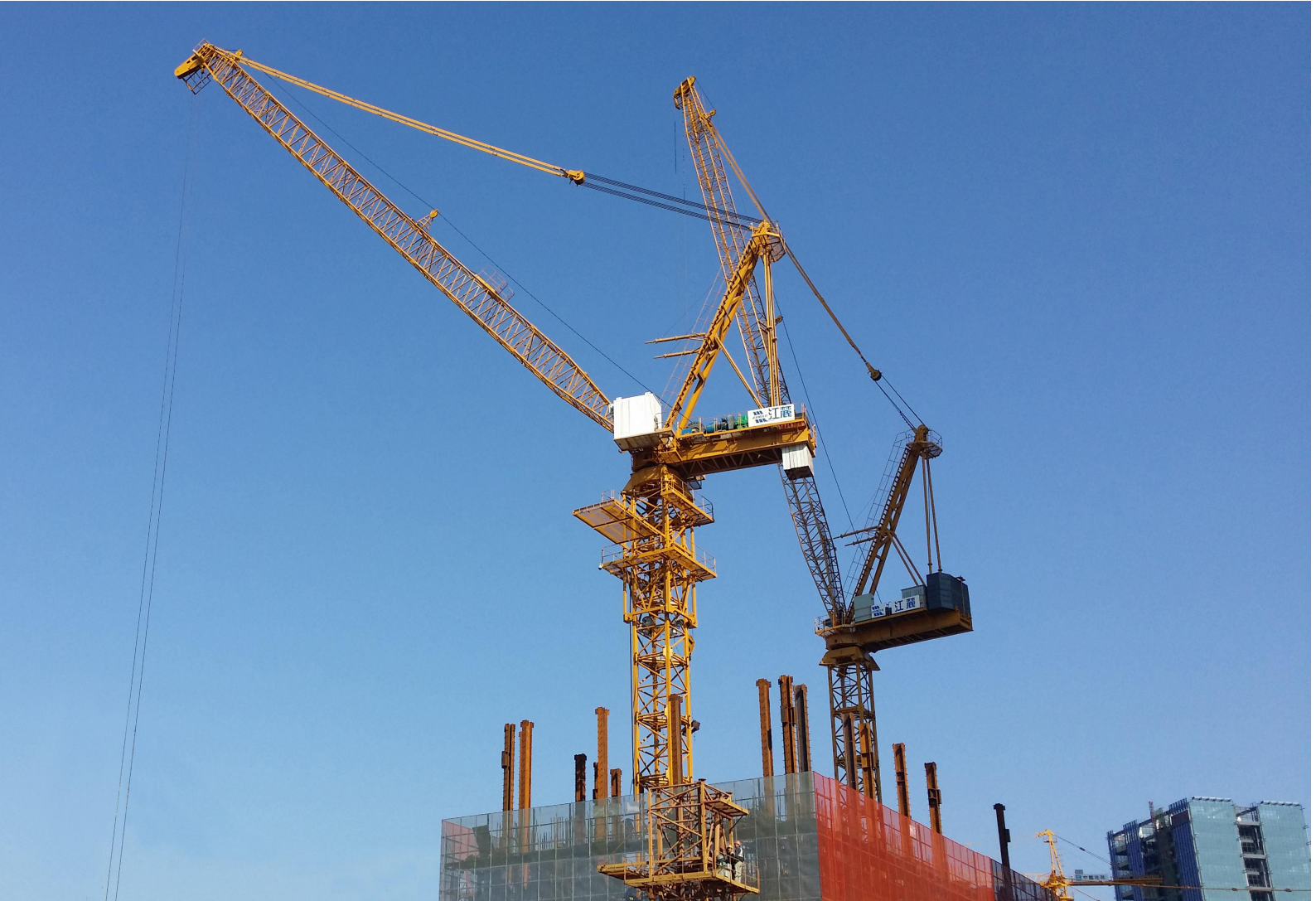
江麓 QTD315、QTD480 塔机福建钱晟项目

公司通过 40 年发展，现已形成了三大系列塔机产品（塔头式塔机、动臂式塔机、平头式塔机），并实现了产品智能化、服务智能化、制造智能化，是塔机行业领先企业。产品起重力矩涵盖 63tm~1100tm，工作臂长涵盖 25 米至 80 米，起重量涵盖 6 吨至 63 吨，能满足高层建筑、能源、交通，水利水电等工程项目施工的需要。施工升降机现有两大系列 14 种规格产品，产品性能达到国内领先水平，同时江麓牌施工升降机在非标设计、安装方面（大型桥梁施工及 200m 以上高层建筑施工）有着丰富的经验和能力，并先后参建了广州白鹤洞大桥、汕头大桥、荆岳大桥、重庆长江大桥等多个国家重点工程建设。