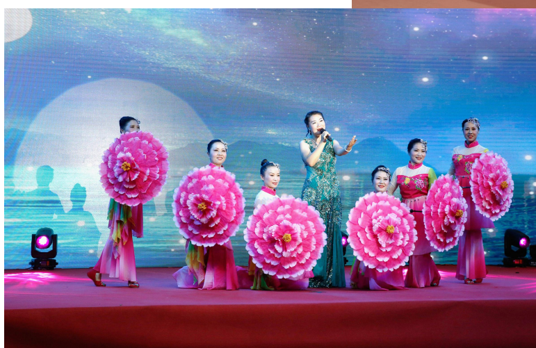
公司庆国庆迎中秋文艺晚会