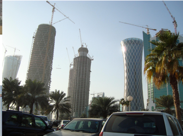
→ 江麓塔机在杭州国际会议中心