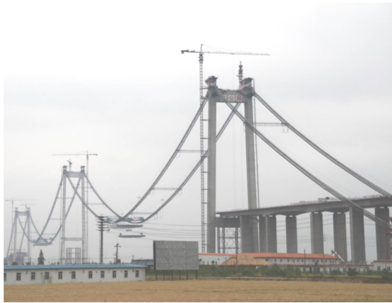
↑ 江麓 QTZ315A 中交集团泰州长江大桥