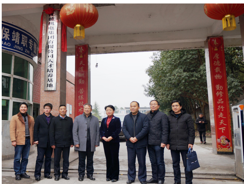
保靖县职专联合办学揭牌仪式

（五）为拓宽扶贫渠道，实现扶智、扶技相结合，公司积极与保靖县职业中专开展联合办学培训。2019 年 7 月底，公司接受并安排第一批 17 名优秀实习生进厂实习。实现了当年签约，当年履约服务。