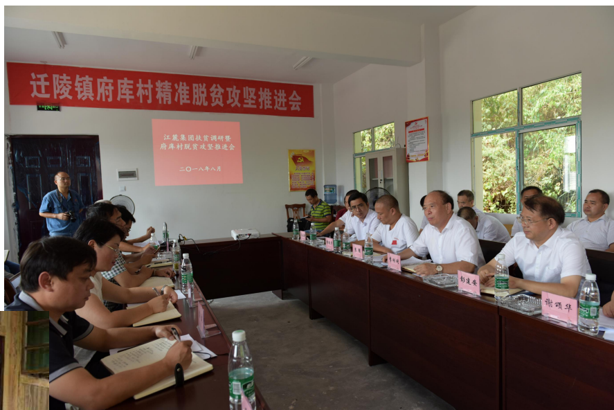
→ 召开府库村脱贫攻坚推进会

公司的精准扶贫工作得到社会各界充分肯定。2019年7月，公司驻府库村工作队扶贫工作被中共保靖县委办授予2018年度驻村扶贫先进工作队“特等奖”称号。《江麓集团：扶贫路上做加法》《江麓集团：教育扶贫助脱贫攻坚》等新闻在《中国军工》、《中国军转民》、《中国兵工报》《湘潭日报》等刊登。