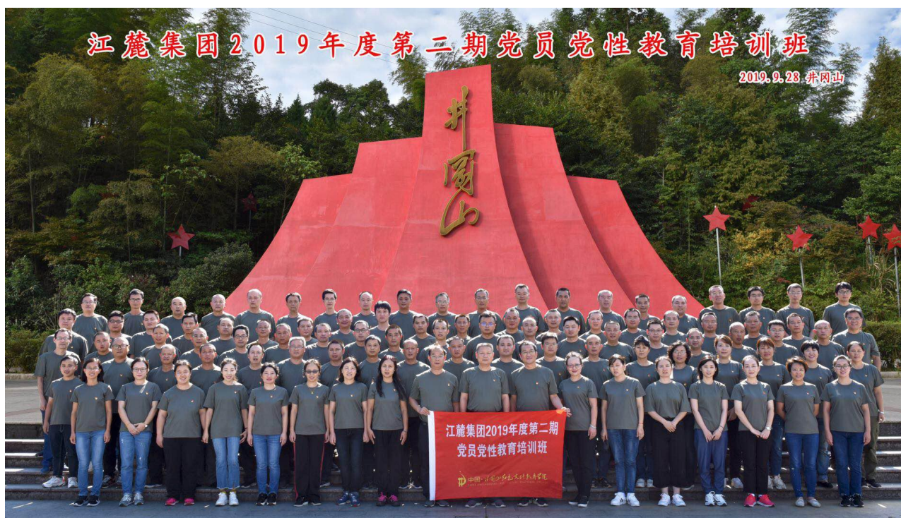
公司组织开展党员党性教育培训活动

培训，累计开展 6 期 596 人次。通过培训，广大党员“四个意识”进一步牢固，“四个自信”进一步增强，“两个维护”更加坚定。