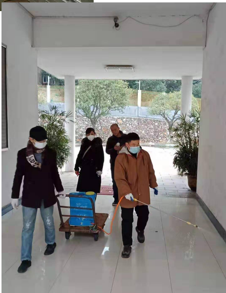
公司物业集中消毒